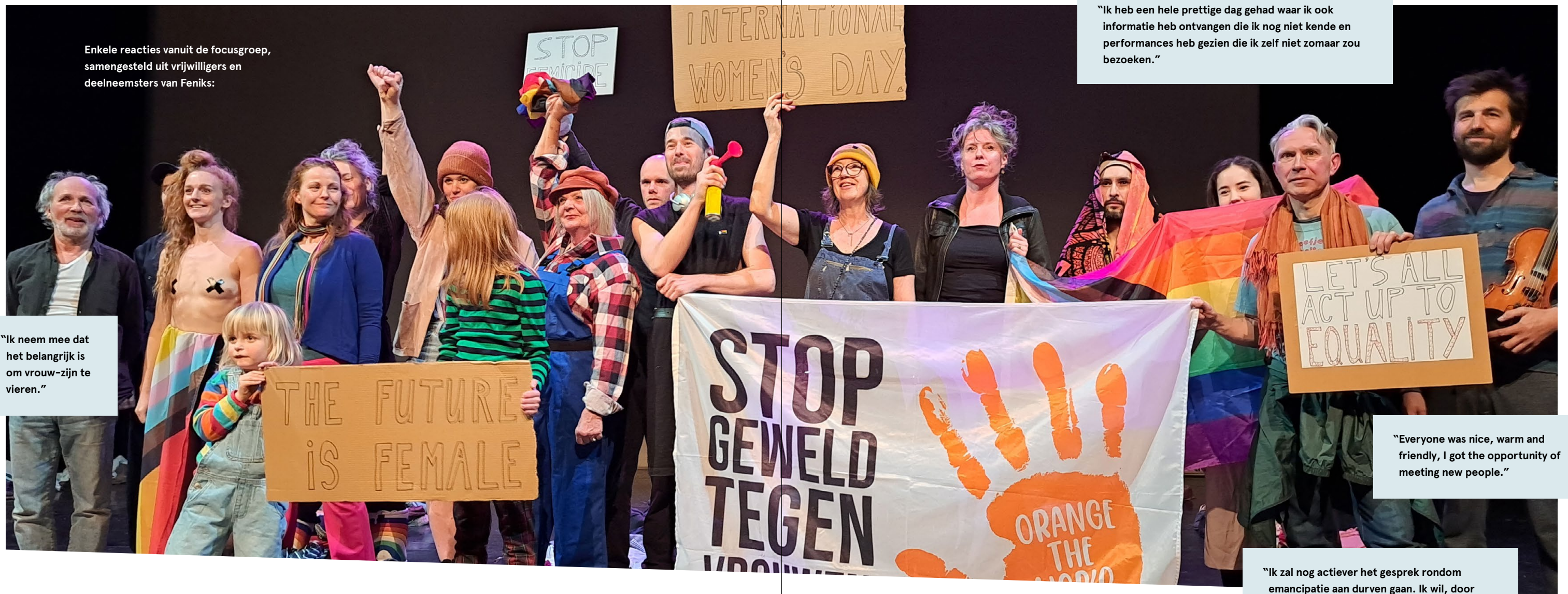
Enkele reacties vanuit de focusgroep, samengesteld uit vrijwilligers en deelnemers van Feniks:

"Ik neem mee dat het belangrijk is om vrouw-zijn te vieren."