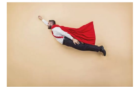
Van mannen wordt nog steeds verwacht dat ze een echte man zijn.

In het BD van 20 december jongstleden las ik het artikel 'De mannelijkheid staat onder druk'. Hierin worden de resultaten van een kleine steekproef over mannelijkheid gepresenteerd. Wat blijkt? Gemiddeld zes van de tien mannen tussen de 18 en 35 jaar vinden dat mannelijkheid onder druk staat en ongeveer de helft vindt dat mannen niet meer zichzelf kunnen zijn, omdat de maatschappij volgens hen vervrouwelijkt is. Ze snappen niet dat het omgekeerde waar is.