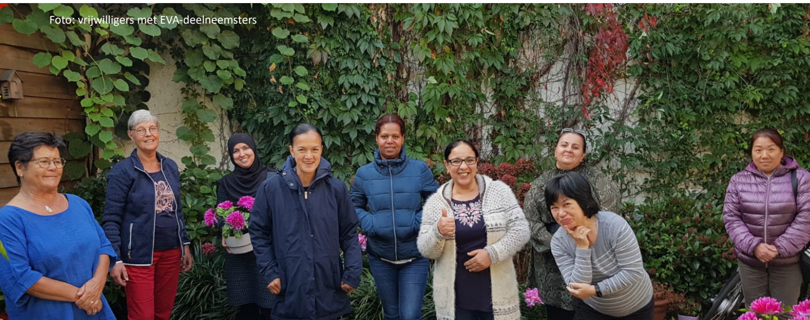
Foto: vrijwilligers met EVA-deelnemers

"HELAAS MOEST IK VERHUIZEN NAAR EEN ANDERE STAD. MAAR IK HEB MEER DAN EEN HALF-JAAR BIJ JULLIE GEOEFEND MET NEDERLANDS. DAAROM BEN IK NU NIET MEER BANG OM TE PRATEN MET NIEUWE MENSEN." - DEELNEEMSTER EVA