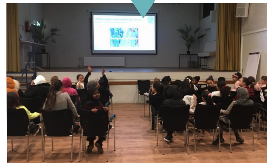
Foto: presentatie voor jonge meiden uit Tilburg-Noord in Wijkcentrum de Ypelaer

Daarnaast zijn diverse beleidssignalen doorgegeven aan de gemeente en aan ContourdeTwern. Zo duurde het heel lang voordat de coronamaatregelen in diverse talen beschikbaar waren, bijvoorbeeld in het Somalisch, Eritrees, etc. Omdat sommige deelnemers voornamelijk naar televisie uit het thuisland kijken, kregen zij niet de juiste info en/of vatten zij de maatregelen te letterlijk en te streng op, waardoor zijn hun huis niet uit durfden te komen. Verder zijn signalen doorgegeven dat de informatie over hulpzoeken bij partnergeweld te weinig zichtbaar was op de T-Helpt pagina en is een ingezonden