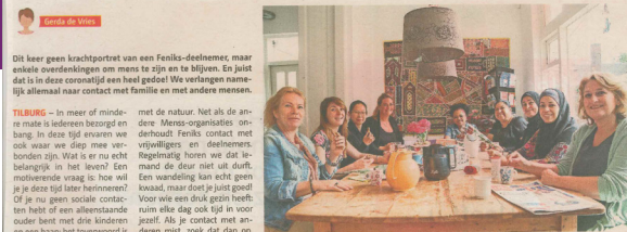
Met haar oog steekt bij Feniks, of is het op glimst.

Dit keer geen krachtproef van een Feniks-deelnemer, maar enkele overdenkingen om eens te zijn en te blijven. En juist dat is in deze coronatijd een heel goed idee: vasthouden en ook weer van diep naar voren bewegen. Het is er nu echt belangrijk in het leven! Een moedervraag is hoe wil je in deze tijd later herinneren? Of je nu geen sociale contact hebt of een allentante ouder kent met drie kinderen en een baam het toevond is in de dagelijkse ritme van optaan, dochten, gezond eten en bewegen laat de hoesmet die we juist nu nodig hebben. Sla jezelf doelen, ook als je weinig om handen hebt. Leef met de dag als het mogelijk is om vooruit te kijken. Zing voor afleiding, bijvoorbeeld door het starten van een hobby, want anders ga je piekeren. Tips vind je op www.fenikstilburg.nl . Wandeling kan Gezondheidszorg en sociale verbinding met anderen en