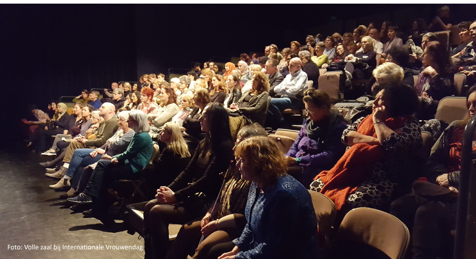
Foto: Volle zaal bij Internationale Vrouwendag