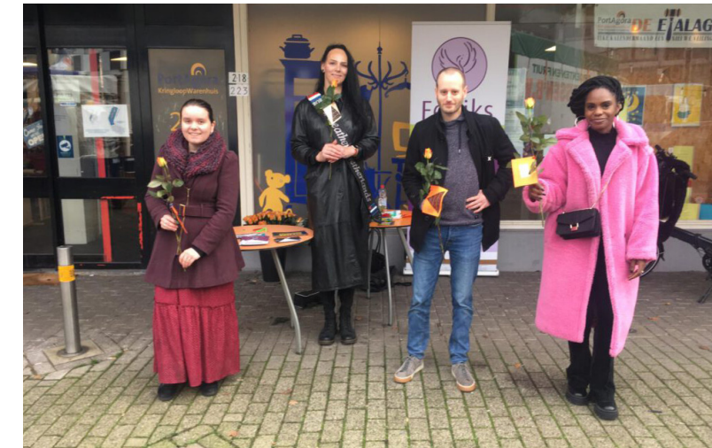
Foto: Oranje rozen uitdelen op de markt tijdens Orange the World

we cadeautjes voor de kinderen, die we langsbrachten. Ook hebben we in het afgelopen jaar enkele zorgelijke casussen m.b.t. partnergeweld opgepakt.