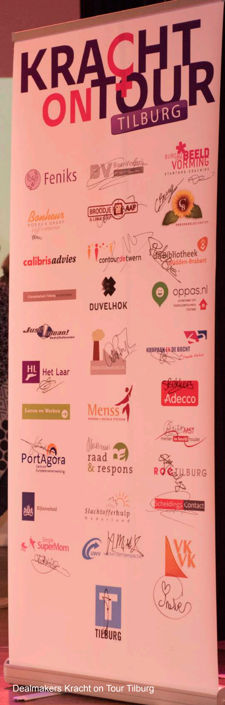
Dealmakers Kracht on Tour Tilburg