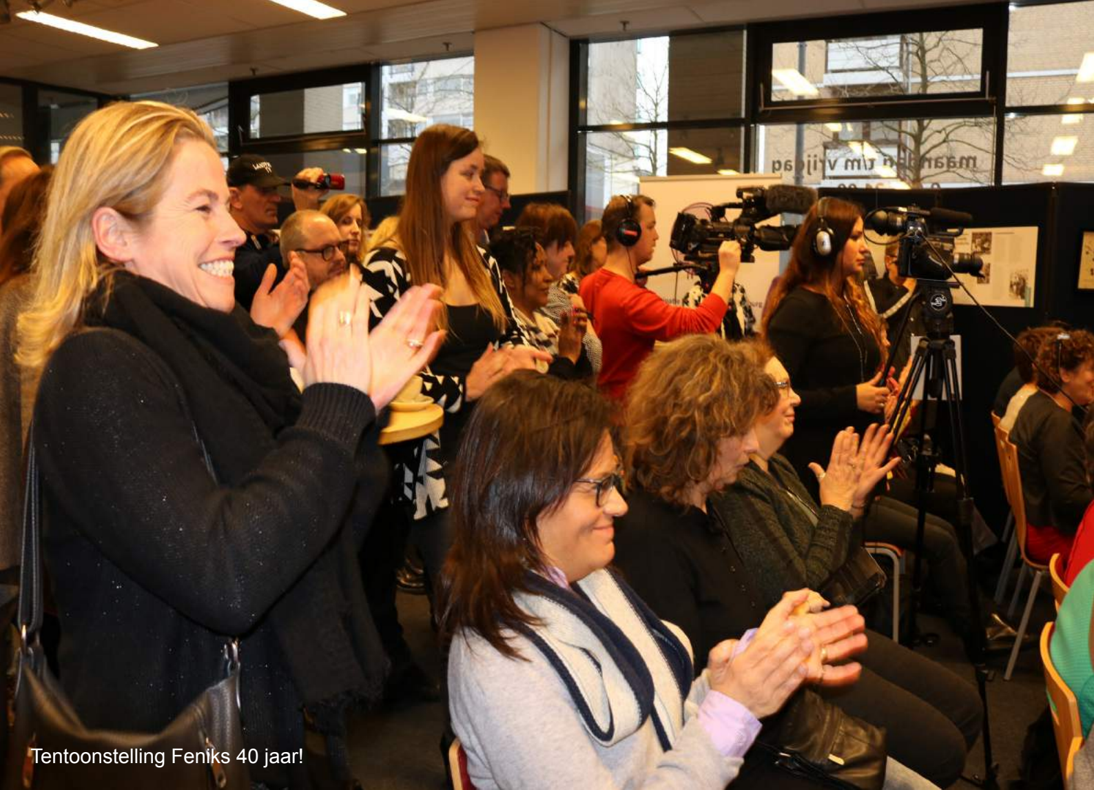
Tentoonstelling Feniks 40 jaar!

Een mooie tentoonstelling. Leuk om de geschiedenis en ontstaan van Feniks te zien. En nog steeds duidelijk hard nodig. Respect voor alle dames bij Feniks Nadia.