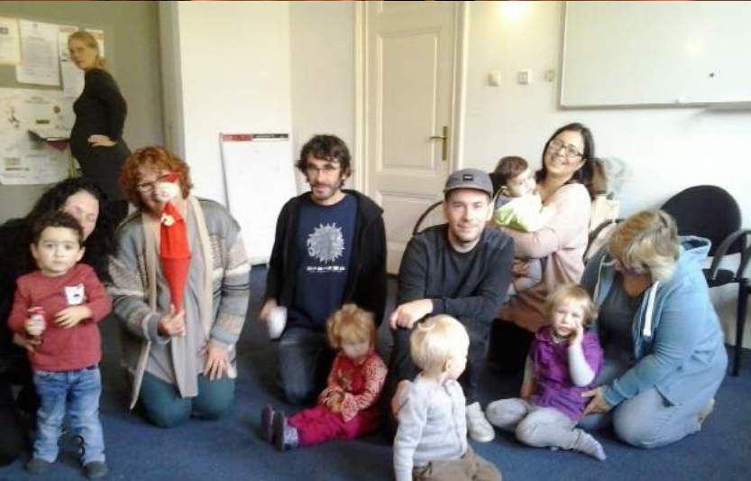
Muziek met je kind cursus